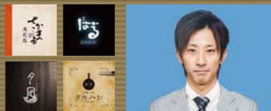
釧路「さかまる」チェーン店 ONO株式会社